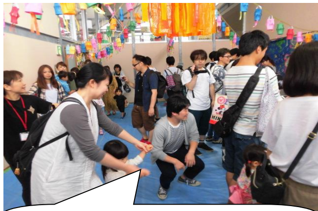
幼児クラブのおともだちみんなで、 盆踊りを踊ってくれました！