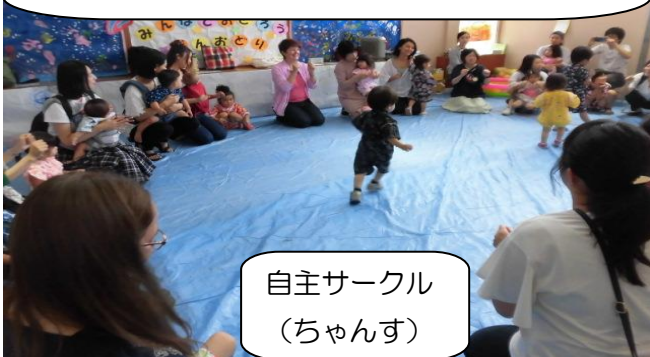
自主サークル (ちゃんす)