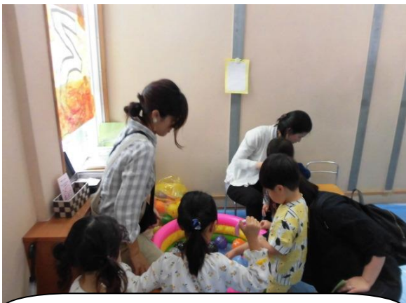
ヨーヨーやわなげは うまくなってきたかな？