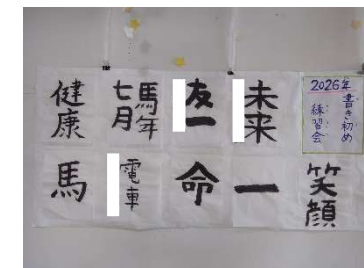
書初め練習会 今年の目標は廊下に飾ってあるよ

※活動中に撮影した写真はセンターだより・SNSに掲載したり、 館内に掲示したりすることがありますのでご了承ください。 不都合のある方は、事前にお申し出下さい。