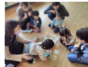
親子ふれあいランド カルタに挑戦したよ！