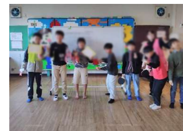
冬の卓球大会 優勝は5年生Rくん