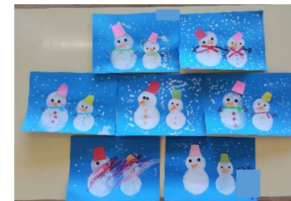
ちびっこ画家の日 雪だるまをつくりました♪