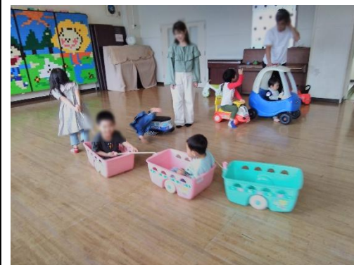
のりもののひろば